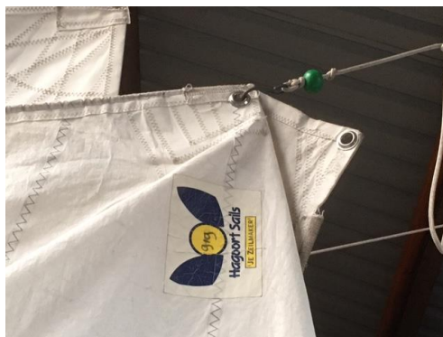
Het grootzeil hang je op aan de Cunningham hole