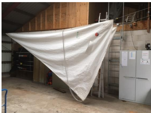
De fokkeschoot hang je over het voorlijk